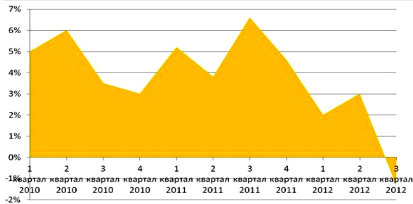
Рис. 2. Рост украинского ВВП в период с 01.01.2010 по 01.09.2012 гг.

Как видно, финансовый кризис привел к падению ВВП, поэтому беря во внимание все негативные последствия, возникает вопрос: "Какие существуют пути выхода из кризиса?". По мнению автора, преодолеть финансовый кризис поможет повышение уровня налогообложения импорта, обеспечение равномерного налогообложения всех сфер экономики и прогрессивность налоговой системы. При сохранении существующей налоговой системы все последствия кризиса в основном будут оплачиваться малообеспеченными слоями населения. Усиление граничного контроля за поступлением в страну "серого" и "черного" импорта, который, помимо невыплаты налогов, приводит к вывозу иностранной валюты из страны. Также необходимо стимулировать инвестиционную активность, вплоть до предоставления определенных льгот инвесторам. Увеличение доли государственной собственности, усиление контроля за банками, укрепление национальной валюты (норма о продаже части валютной выручки от 18.11.2012 г. может привести к укреплению курса ниже 8 грн за 1 доллар [6]). Украине важно не только минимизировать негативное влияние мирового финансового кризиса, но и найти соответствующее место на мировом рынке после преодоления его последствий [1, с. 38; 4, с. 33–34].