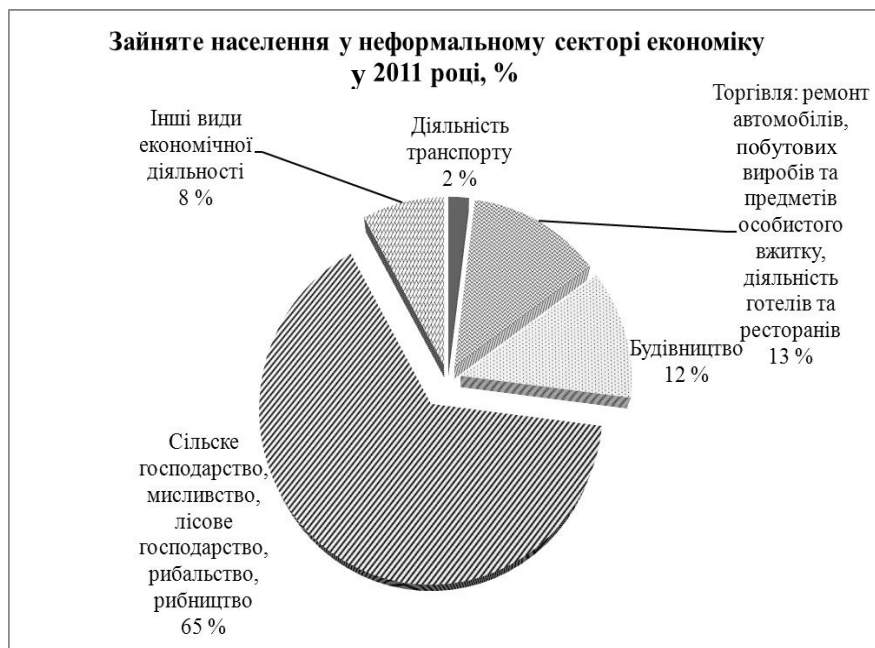
Рис. 1. Зайняте населення у неформальному секторі економіки у 2011 році

Чисельність офіційно працюючих зрівнялася з чисельністю пенсіонерів, відповідно, збільшується навантаження на державний бюджет, унаслідок чого неможливо забезпечити гідні пенсії та інші соціальні виплати. Окрім того, українці, що працюють у неформальному секторі економіки (рис. 1) [2], позбавлені багатьох факторів соціального захисту в разі настання страхового випадку.