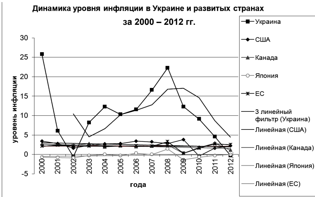
Рис. 1. Динамика уровня инфляции в Украине и развитых странах за 2000 – 2012 гг.

С 2008 г. уровень инфляции в Украине стал значительно снижаться. Линия тренда за период 2001 – 2012 гг. имеет снижающийся характер, что является положительным явлением.