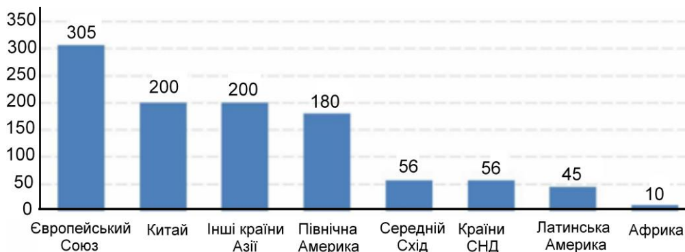
Рис. 2. Заплановані середньорічні обсяги інвестицій в інфраструктуру в 2010–2020 рр., млрд дол. США

Для розвитку виробничої інфраструктури агросфери важливими є обсяги нарощення будівництва нових об'єктів та ремонт існуючих. Наразі Україна не має змоги піднятися до рівня інвестування інфраструктурних проектів розвиненими державами. Заплановані середньорічні обсяги інвестицій в інфраструктуру на 2010 – 2020 рр. (рис. 2) свідчать про те, що частка всіх інвестиційних ресурсів, які припадають на країни пострадянського простору, майже вшестеро менше від вкладень у розвиток інфраструктури країн Євросоюзу [5, с. 69].