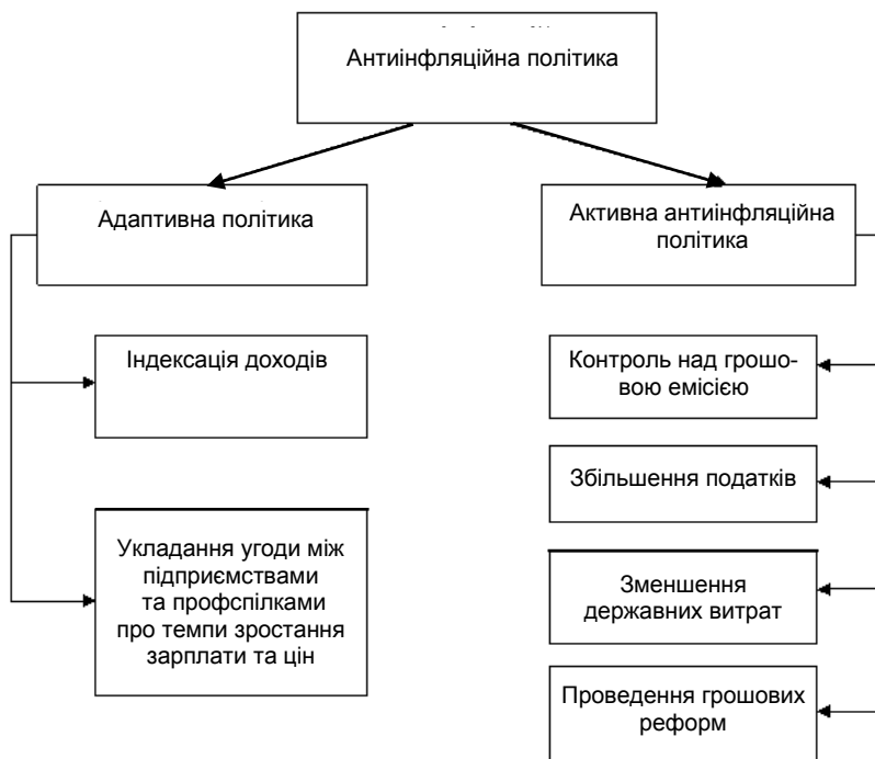
Рис. 1. Види та інструменти антиінфляційної політики [5]

Дефляційна політика використовує фінансовий і кредитно-грошовий механізми задля регулювання та обмеження платоспроможного попиту. Цю політику проводять за умов, коли переважним чинником інфляції є тиск зайвих грошей у каналах обігу. Ця політика здійснюється, в першу чергу, скороченням витрат державного бюджету, таким чином зменшується надходження зайвих коштів в обігу. Скороченням підлягають, передусім, субсидії підприємствам, виділення на соціальні потреби, інфраструктуру, на потреби військово-промислового комплексу. Щоб вилучити зайві кошти, що надійшли туди раніше, як правило посилюється податковий тиск на доходи. Незалежно від цього мобілізовані в бюджет через податки гроші можуть знову брати участь в обігу у вигляді державних витрат. Запобігти цьому можна реальним зменшенням бюджетних витрат, насамперед, невиробничого призначення.