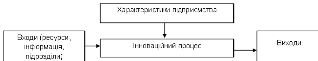
Рис. 2. Інноваційний процес як процес перетворення [9, с. 96]

Інноваційний процес у первинному наближенні розглядається як процес перетворення вхідів (ресурсів, інформації тощо) на виходи (нові товари, нові технології тощо). Даний підхід заснований на припущенні, що процес нововведення пов'язаний із творчою діяльністю, власне є ірраціональним і неорганізованим та описується моделлю типу "чорна скринька" (рис. 2).