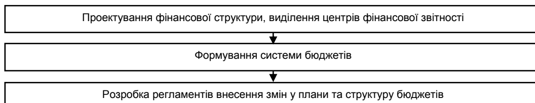
Рис. 1. Основні етапи впровадження бюджетування

Етапи розробки і впровадження бюджетування є досить комплексними та трудомісткими, проте узагальнено їх можна подати у вигляді схеми (рис. 1) [1 – 3].