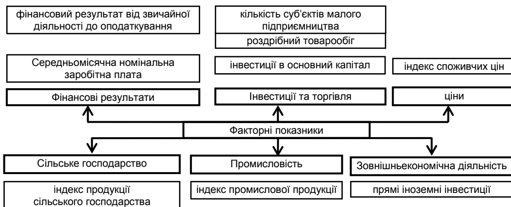
Рис. 1. Групування показників для виділення факторів впливу на обсяги податкових надходжень до бюджету Харківської області

Для проведення ефективної податкової політики необхідно визначати основні фактори, що впливають на результативні показники функціонування податкової системи. Одним із найважливіших завдань є виокремлення серед великої кількості макро- та макроекономічних показників невеликої кількості провідних факторів, що мають безпосередній вплив на функціонування податкової системи держави. На рис. 1 зображено групи факторів, які були обрані для аналізу.