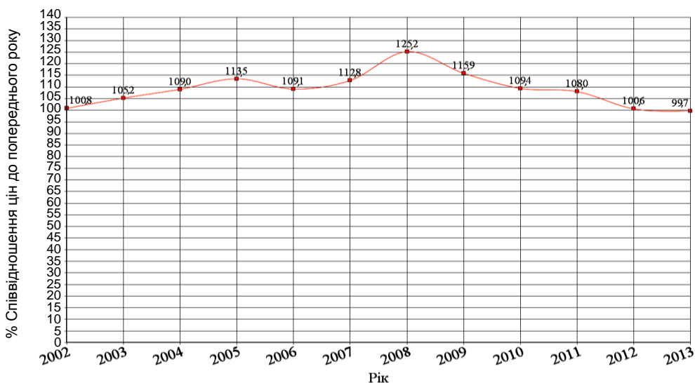
Рис. 2. Лінія відсоткового співвідношення ІСЦ в Україні за період 2002 – 2013 років (у % до попереднього року)

Слід зобразити співвідношення ІСЦ в Україні графічно (рис. 2).