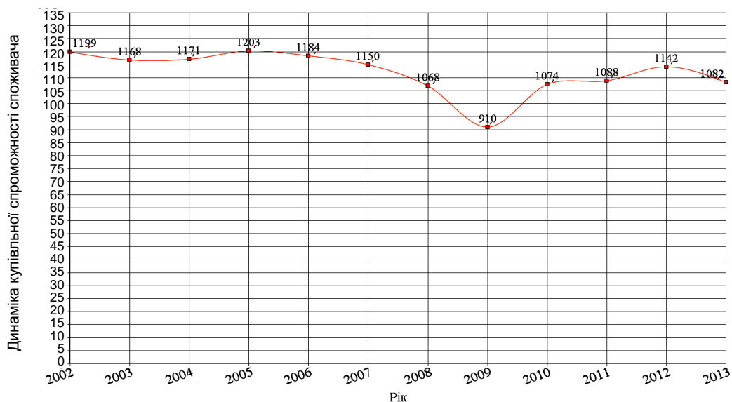
Рис. 4. Динаміка купівельної спроможності українського споживача за період 2002 – 2013 років (у % до попереднього року)

Отримані дані варто використати для побудови графіка "Динаміка купівельної спроможності українського споживача" (рис. 4).