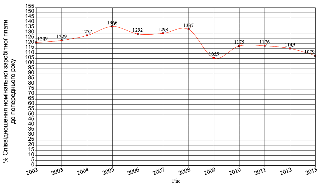
Рис. 3. Лінія процентного співвідношення номінальної заробітної плати в Україні за період 2002 – 2013 років (у % до попереднього року)

Результати розрахунків відсоткового співвідношення номінальної заробітної плати споживача за період 2002 – 2013 роки в Україні варто використати для побудови лінії відсоткового співвідношення номінальної заробітної плати (рис. 3).