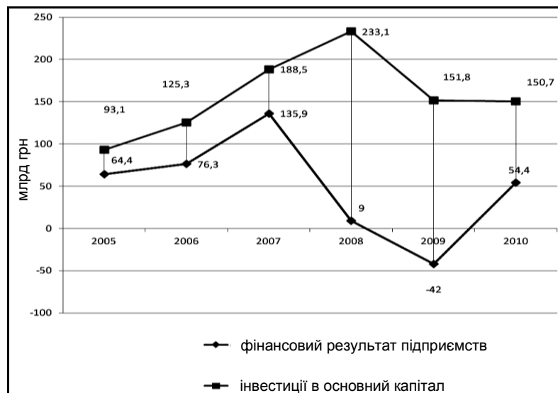
Рис. 2. Динаміка інвестування в основний капітал (у фактичних цінах) та фінансового результату підприємств до оподаткування

Спостерігається збільшення обсягів інвестування підприємствами з власних джерел внаслідок покращення їхнього фінансового стану. На фоні кризових тенденцій, коли фінансовий результат підприємств від звичайної діяльності до оподаткування досяг найбільшого негативного рівня (у 2009 р. фінансові збитки сягнули 42,4 млрд грн), у 2010, 2011 рр. відбувається поступове покращення фінансового стану підприємств. Зокрема, у 2010 р. позитивний фінансовий результат від звичайної діяльності до оподаткування становив 63,3 млрд грн, а кількість підприємств, які одержали прибуток, досягла 63,2 % від їхньої загальної кількості. Вже за вісім місяців 2011 р. позитивний фінансовий результат становив 64,8 млрд грн (рис. 2).