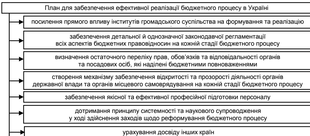
Рис. 2. План для забезпечення ефективної реалізації бюджетного процесу в Україні

Важливі вектори, що здатні будуть забезпечити ефективну реалізацію бюджетного процесу в Україні, наведені на рис. 2.