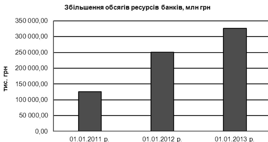
Рис. 1. Динаміка зміни ресурсів банків України

Тому особливої ваги набуває аналіз пасивів банку, метою якого і є надання інформації про поточний стан банківських ресурсів (кількісна та якісна оцінка структури власних і залучених коштів), яка становить основу при прийнятті рішень про оптимізацію їх структури.