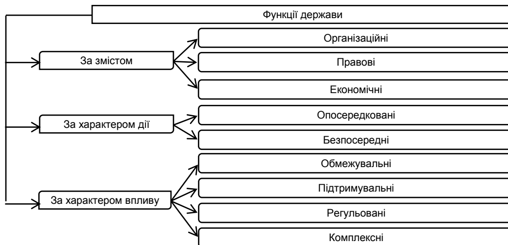
Рис. 1. Функції держави

У ході вироблення адекватної політики забезпечення економічної безпеки підприємництва необхідно акцентувати увагу на тих складових ролі держави, які вона може виконувати у процесі реалізації своєї інституціональної функції. Насамперед роль держави визначається відповідно до змісту, характеру впливу та дії (рис. 1).