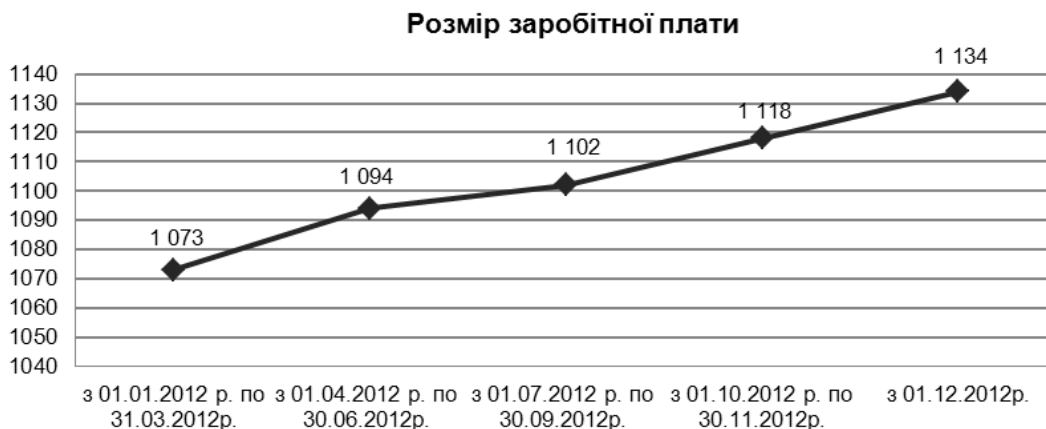
Рис. 1. Розмір заробітної плати в 2012 р. у розмірі за місяць

Для наочного порівняння наведено нижче розміри мінімальної зарплати в 2012 році, встановлені статтею 13 Закону України "Про Державний бюджет на 2012 рік" у розмірі за місяць (рис. 1).