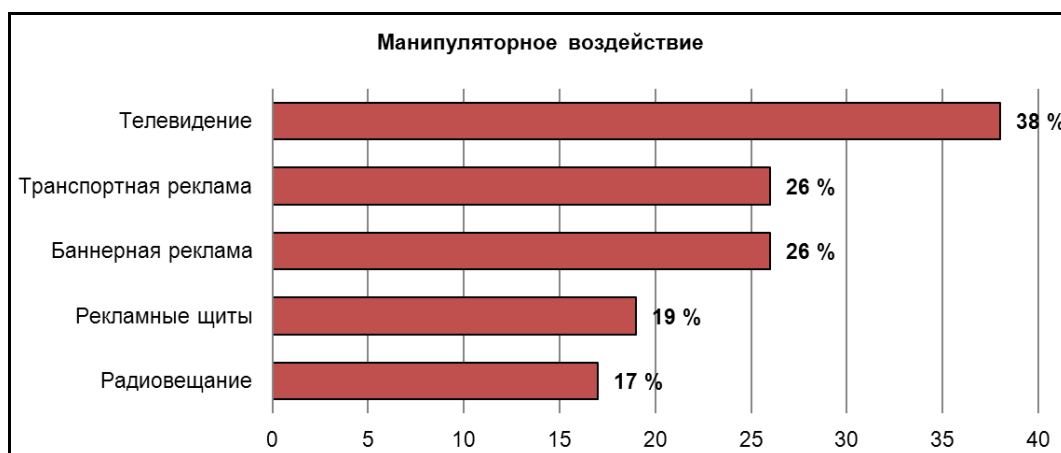
Рис. 2. Источники маркетингового воздействия на потребителей

В ходе исследования составлен рейтинговый список основных источников маркетингового воздействия на клиентскую базу, которые являются наиболее распространенными на данный момент. 38 % – телерекламу и рекламу в общественном транспорте 26 % респондентов считают особо действенной в отношении навязывания потребителям желаний купить тот или иной товар, воспользоваться той или иной услугой. Наименее эффективным, с точки зрения маркетинга 17 % респондентов. Аналогичного мнения о баннерной рекламе придерживаются также 26 %. Рекламные щиты (билборды) выделили как наиболее привлекательные 19 % респондентов. Радиовещание – 17 % (рис. 2).