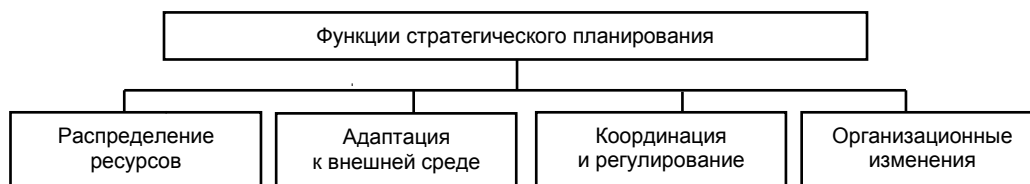
Рис. 2. Функциональная структура стратегического планирования

К ним относятся: распределение ресурсов, адаптация к внешней среде, внутренняя координация и регулирование, организационные изменения (рис. 2).