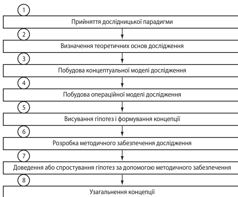
Рис. 1. Структурно-логічна схема наукового дослідження

2 етап. Серед галузевих теорій, які охоплюють своїм описом і поясненням широке коло явищ у рамках окремих сфер економіки.