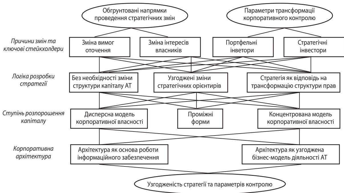
Рис. 3. Профіль узгодження контурів корпоративного та стратегічного управління в АТ (відповідає позиції рР на рис. 2)

Таким чином у статті висвітлено методологію узгодженої реалізації контурів стратегічного та корпоративного управління, що дозволяє забезпечити взаємну підпорядкованість зміни стратегічних орієнтирів розвитку акціонерного товариства процесам трансформації корпоративного контролю. Основу досягнення такої підпорядкованості становить гармонізація стратегічних інтересів усіх ключових стейкхолдерів у рамках циклічного співвіднесення сфер впливу стратегічного та корпоративного управління на таку гармонізацію. В основу формування механізму корпоративного контролю покладено поєднання стейкхолдерського й архітектурного підходів. Це досягнуто шляхом проведення відповідного морфологічного аналізу, результати якого стали основою змістовного визначення профілю узгодження процесів розробки стратегії та трансформації контролю.