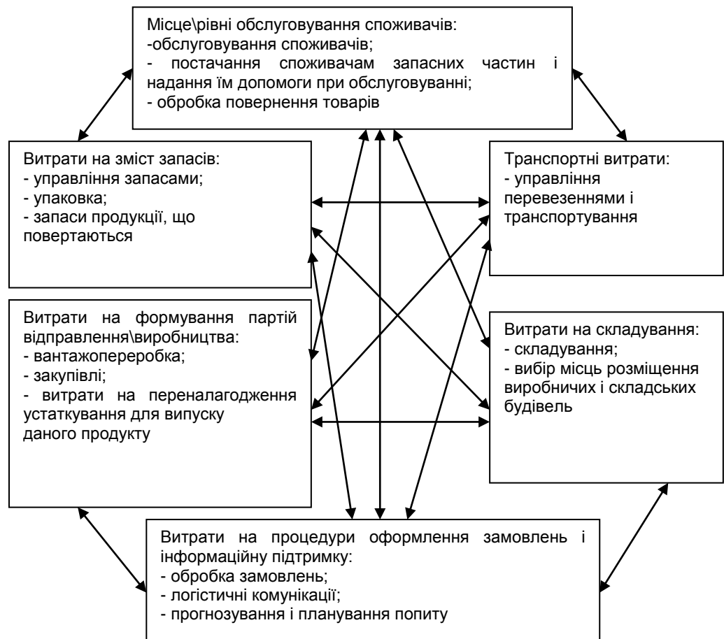
Рис. 1. Вплив різних видів логістичної діяльності на загальні логістичні витрати

Також чинники формування логістичних витрат можуть бути: