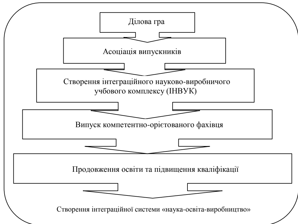
Рис. 3. Етапи налагодження взаємодії між ВНЗ та бізнесом

компетентно-орієнтованого фахівця та практично сприяючи продовженню освіти та підвищенню кваліфікації університетська освіта стає більш ефективною як з позиції споживача послуг (абітурієнт, виробництво), так і з позиції самого ВНЗ.