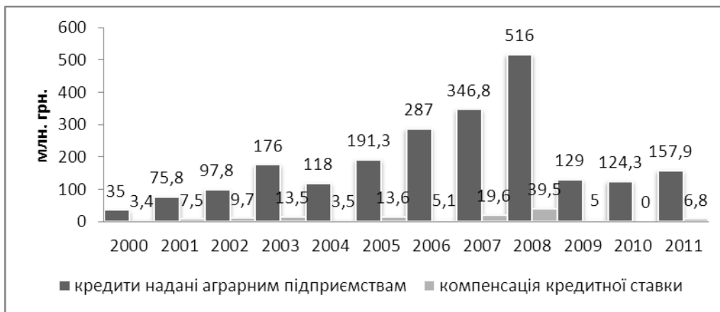
Рис. 2. Динаміка забезпечення кредитними ресурсами аграрних підприємств Луганської області, 2000-2011 рр.

Якщо взяти окремі підприємства Луганської області ми побачимо що кредити займають максимально 15,5% а в середньому тільки 9,2% в структурі капіталу.