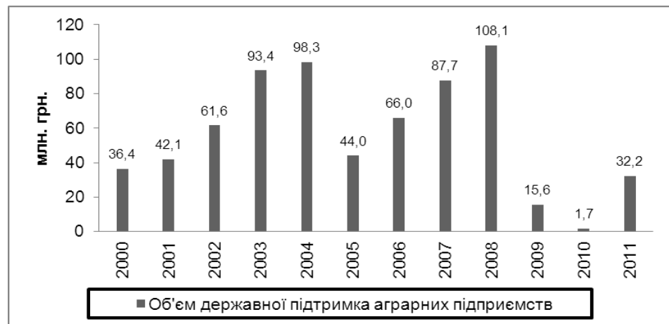
Рис.1. Динаміка державної підтримки аграрних підприємств Луганської області за 2000-2011 рр.

Проте, у результаті фінансової кризи державна підтримка аграрних підприємств Луганської області різко скоротилася за останні три роки (рис.1). Самим несприятливим виявився 2010р., держпідтримка скоротилася більш ніж в 21 раз порівняно з 2000 р., в 2011 досягла майже 2000 р., хоча і в 3,4 рази менше ніж в докризовом 2008 р.