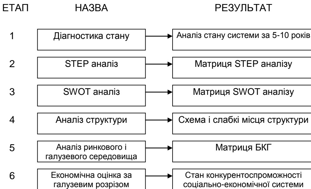
Рис. 1. Процес контролю розвитку соціально-економічної системи, за допомогою аналізу її середовища