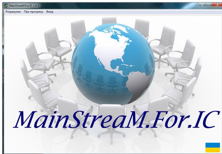
Рис. 1. Головне операційне вікно цільової комп'ютерної програми « MainStream.For.IC v.6.3 »

Результати дослідження. Виходячи з цих позицій, розроблено методологію макроекономічного регулювання процесів забезпечення ефективності використання інтелектуального капіталу та запропоновано цільовий програмний продукт « MainStream.For.IC v.6.3 » (рис. 1) [1]. Ці розробки є спробою використати прикладний інструментарій для провадження об'єктивних процедур по оцінюванню-прогнозуванню параметричних змін інтелектуального капіталу і розробки стратегії його формування в контексті модернізації національного господарства [2].