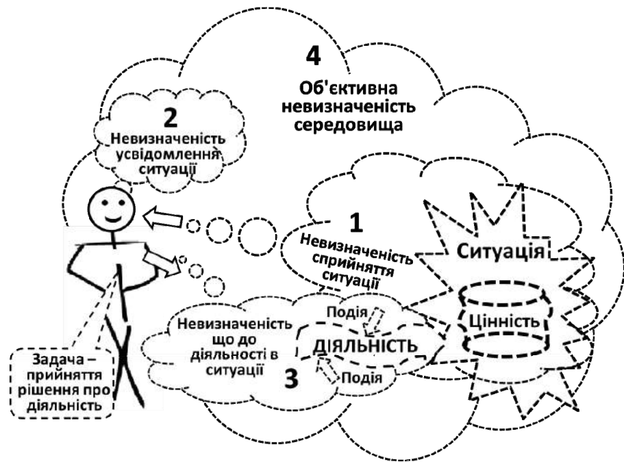
Рис. 2. Графічна модель стану невизначеності особи, якій необхідно прийняти рішення

Виходячи з цієї моделі можна запропонувати наступне визначення терміну «невизначеність».