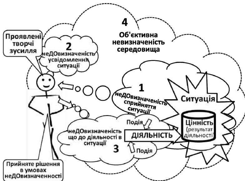
Рис. 3. Графічна модель стану умовної визначеності особи, яка прийняла рішення

А суб'єктивна ступень недовизначеності буде виступати одним з факторів (але не єдиним і не обов'язково головним) який є причиною можливого відхилення фактичного стану діяльності в конкретний момент часу від того, який планувався. Таку ситуацію називають ризиковою [67]. Як впливає з таблиці 5 при розгляді ризику основний акцент роблять на негативних наслідках відхилення. Виходячи з цього можна запропонувати наступне визначення терміну «ризик».