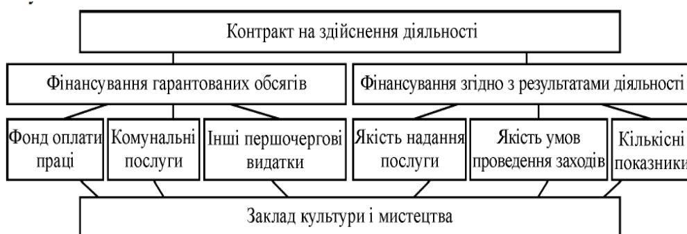
Рис. 2. Схема фінансування закладів культури і мистецтва за результатами діяльності [14]

отримує додаткове фінансування. Але державні органи та навчальні заходи не приділяють цьому джерелу належної уваги.