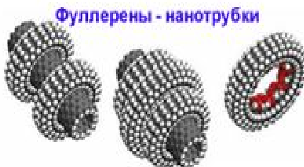
Рисунок 1. – Схематичне зображення молекул фулерену

На сьогоднішній день існує виробництво фулеренової сажі (політерафторетилен) та продуктів на її основі, екстрактів фулеренів, фулерен C_{60} (з чистотою 99,85\% ), фулерен C_{70} (з чистотою 99,5\% ). Ці продукти мають досить стабільний збут, тому що поліпшують експлуатаційні характеристики транспортних засобів і інших спеціальних механізмів; використовуються в присадках та добавках до масел і мастил, що різко підвищує зносостійкість пар тертя в машинах і механізмах, та підвищують їх протизадирні властивості, що працюють в умовах підвищених навантажень. Виготовляються композити гальмівних колодок швидкісних транспортних засобів наземного і авіаційного транспорту з підвищеною тепловіддачею і зносостійкістю; матеріали для зниження зносу в умовах сухого тертя; технологічні складові для мастильно-охолоджуючої рідини, яка збільшує зносостійкість ріжучого інструменту та інше.