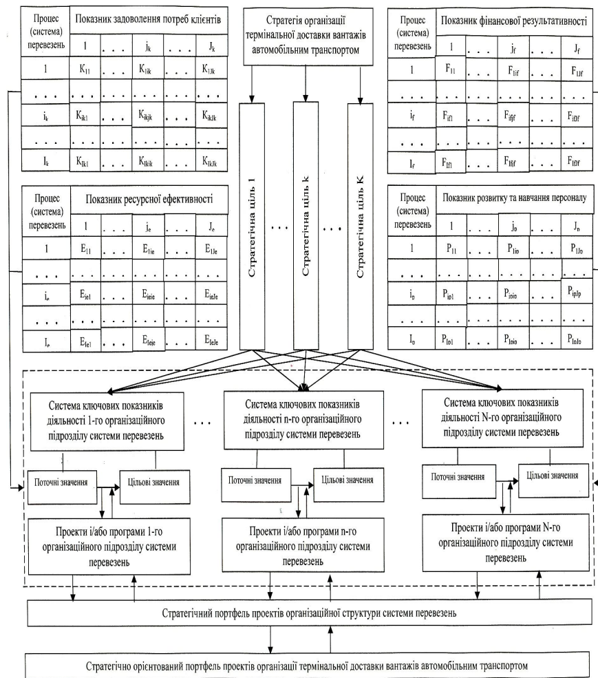
Рисунок 1. – Формування стратегічного портфеля проектів в організаційних структурах систем перевезень організацій термінальної доставки вантажів автомобільним транспортом

відокремлюваних на основі декомпозиції загального процесу термінальної доставки вантажів автомобільним транспортом, групам (підгрупам) потреб клієнтів – термін