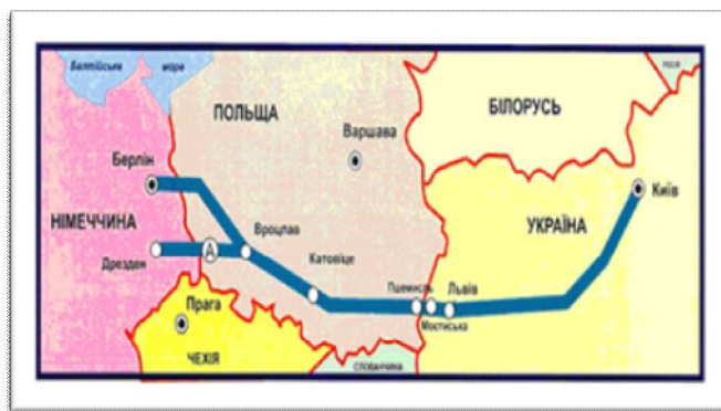
Рис.1. Транс'європейський транспортний коридор № 3

Протяжність основного ходу: 1640 км., в тому числі по Україні: - автодорожний: - 611,7 км. Меморандум про взаєморозуміння щодо коридору №3 підписано в вересні 1996 року Міністрами транспорту України, Німеччини і Польщі.