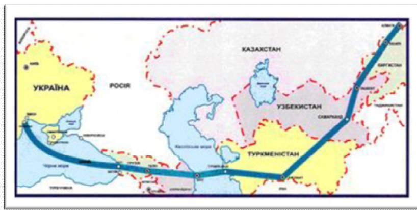
Рис.5. Транспортний коридор Європа – Кавказ – Азія (TRACECA)

конкурентоспроможності, державна допомога та фіскальна гармонізація, безпека руху, технічні вимоги, статистика, екологічні та соціальні вимоги і змішані перевезення.