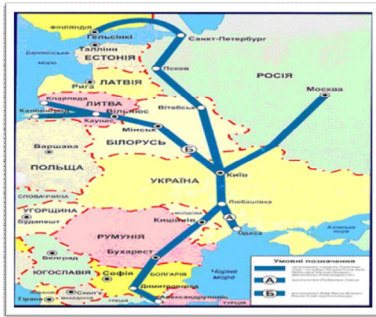
Рис.4. Транс'європейський транспортний коридор № 9

море, що дозволить активізувати діяльність українських транспортних підприємств та збільшити вантажообіг на українській ділянці МТК № 7.