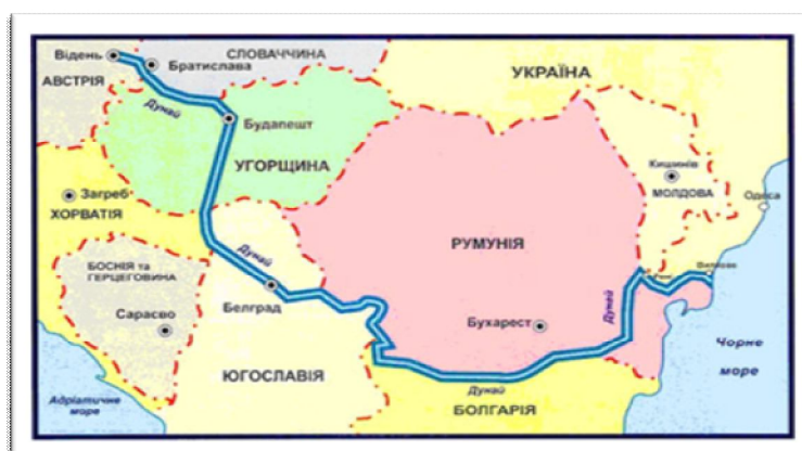
Рис.3. Транс'європейський транспортний коридор № 7. Дунайський (водний).

Протяжність - 1595 км., в тому числі по Україні: - автодорожний - 338,7 км.(в тому числі відгалуження 47,2 км) Меморандум про взаєморозуміння підписано в грудні 1996 року. Головною проблемою транспортного коридору №5 на території України для автомобільного сполучення є подолання Карпатських гір. Для нової автомобільної траси, питання про будівництво якої вивчається вже декілька років та для якої виконано Техніко-економічне обґрунтування, виникає необхідність будівництва великого тунелю та інших велико вартісних споруд.