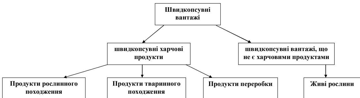
Рисунок 2 – Класифікація швидкокопсувних вантажів, що перевозяться у міжнародному сполученні (авторська розробка)

Нормативно-правові положення проекту Наказу «Правил перевезення швидкокопсувних вантажів автомобільними транспортними засобами» максимально наближені до міжнародних норм, а саме – Угоди про міжнародні перевезення швидкокопсувних харчових продуктів та про спеціальні транспортні засоби, які призначені для цих перевезень. Важливим нововведенням є поділ швидкокопсувних вантажів на швидкокопсувні харчові продукти та швидкокопсувні вантажі, що не є харчовими продуктами (рис. 2.).