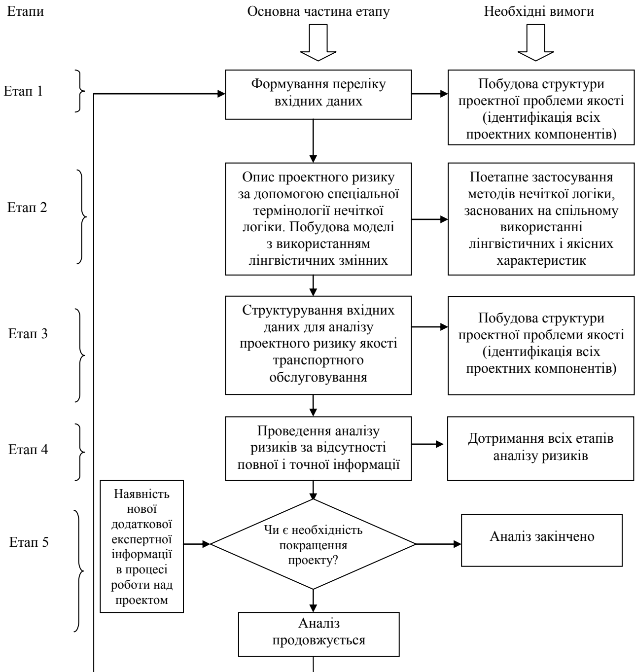
Рисунок 1 – Алгоритм визначення проектного ризику при оцінці якості послуг з використанням методології теорії нечітких множин

Саме використання апарату теорії нечітких множин дає змогу описувати нечіткі поняття і знання, оперувати ними і робити нечіткі висновки.