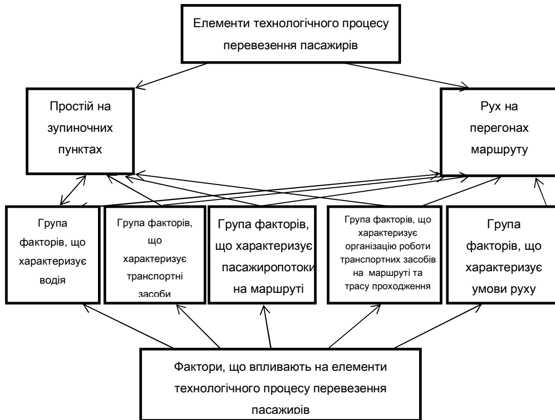
Рисунок 1 – Взаємозв'язок елементів технологічного процесу перевезення пасажирів і факторів, що впливають на них.

Фактори, що впливають на параметри технологічного процесу доцільно поєднати у різні групи.