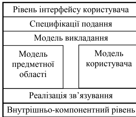
Рисунок 1 – Еталонна модель адаптивної ІСН

Розробимо альтернативну розширену модель самоорганізації ІСН у цілому і організаційної структури знань зокрема, що враховує вимоги різних чинників впливу (рис. 2).