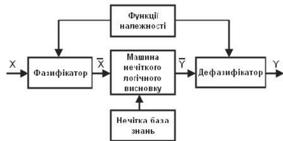
Рис. 2. Структура нечіткої моделі

типи нечітких правил: лінгвістична, реляційна, модель Takagi-Sugeno [2].