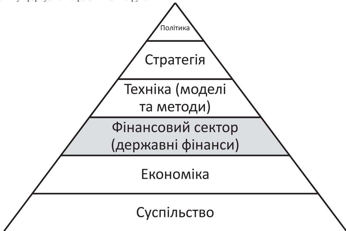
Рис. 2. Узагальнена модель ключових елементів багатовекторної методології управління розвитком фінансового сектор

Управлінський вектор пов'язано із запровадженням “проактивної” моделі середньострокового планування розвитку, яка забезпечить передбачуваність дій у бюджетній сфері. Цей вектор також включає дії, пов'язані з управлінням бюджетом, спрямованим на досягнення соціально значущих результатів та розвиток інструментів фінансового контролю за результативністю та ефективністю діяльності розпорядників бюджетних коштів.