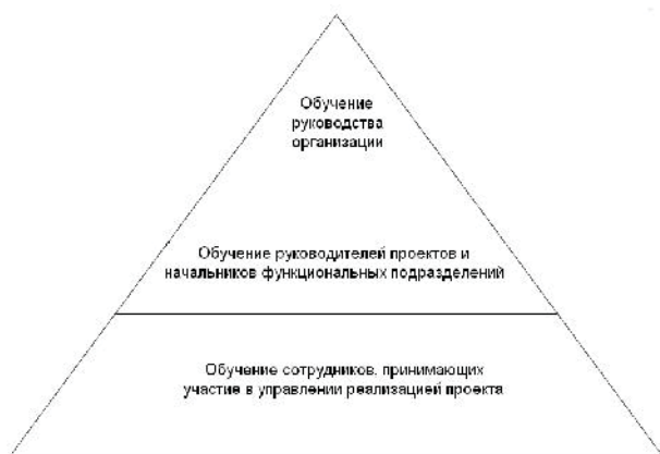
Рис. 3. Уровни обучения персонала

Ни один бизнес-процесс в компании не будет работоспособным без поддерживающей его структуры. Отсутствие контроля за соблюдением регламентов и их развитием по мере увеличения требований бизнеса к принципам проектного управления может сделать новые принципы работы бездействующими. Решением проблемы является создание проектного офиса.