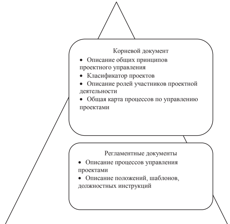
Рис. 2. Документы, входящие в состав методологии управления проектами

должна создаваться внутри компании в соответствии со стандартами управления проектами. Разработкой методологии должна заниматься команда внедрения с привлечением внешних консультантов и экспертов по управлению проектами. В дальнейшем эта рабочая группа станет основой создаваемого проектного офиса, который будет отвечать за разработку и развитие данной методологии внутри организации.