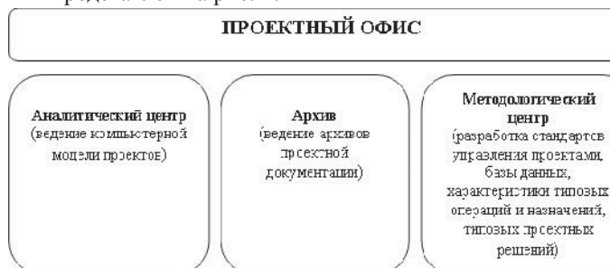
Рис. 4. Типовой состав проектного офиса

Проектный офис – организационная структура, вся деятельность которой направлена на упорядочивание и развитие проектной деятельности компании. Типовой состав проектного офиса представлен на рис. 4.