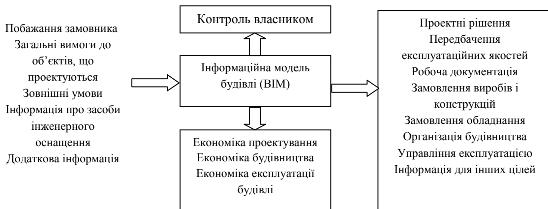
Рис. 1. Основна інформація, що проходить через BIM і має до BIM пряме відношення

Схематично вхідна і вихідна інформація, що належить до BIM, показана на рис.1.