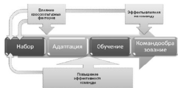
Рис. 2. Общая схема процесса набора персонала

Представленная на рис.2 схема набора в команду проекта реализована в программном коде