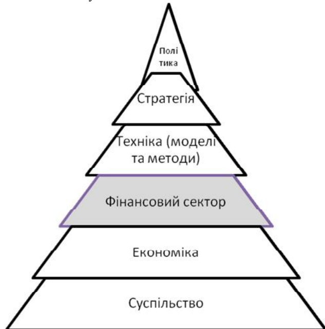
Рис.1. Узагальнена модель ключових елементів багатовекторної методології управління розвитком фінансового сектору

Методологія базується на політиці розвитку фінансового сектору. На основі визначеної політики розвитку формується стратегія та інструменти її реалізації – моделі та методи. Фундаментом моделі є економіка та суспільство.