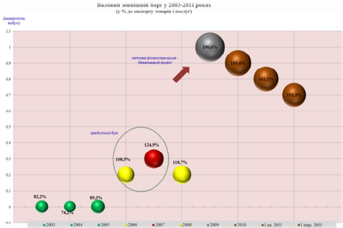
Рис.4. Приклад кулькової моделі динаміки валового зовнішнього боргу України

Динаміка кульок, що показана на рис. 4, визначає позитивний тренд у реалізації програми «перезавантаження» системи державних фінансів України [1] у 2010 та 2011 роках. Кожна кулька має складну структуру та взаємодію з іншими моделями фінансової системи України.