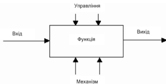
Рис. 1. SADT-блок інформаційної функції процесів планування та моніторингу обсягів навчальної роботи у ВНЗ

Моделювати процеси планування та моніторингу обсягів навчальної роботи будемо за допомогою методології структурного аналізу SADT (Structured Analysis and Design Technique), яка заснована на концепціях системного аналізу і є ефективним інструментом для створення опису систем. Основний компонент моделі це діаграма, яка відображає порядок реалізації інформаційних функцій, ставлячи у відповідність кожній інформаційній функції окремий блок SADT-діаграми. Сама SADT-діаграма складається з блоків, якими позначають функції процесу, що моделюється. Блоки на діаграмах зображуються прямокутниками і супроводжуються текстами на природній мові (рис. 1).