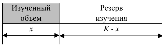
Рисунок 2 - Общая емкость дисциплины K и ее изученная часть x

Закономерность экспоненциального роста уровня подготовки справедлива на начальном этапе обучения. В реальных условиях обучения всегда существует так называемое «сопротивление среды», которое выражается, главным образом, в ограничении роста знаний из-за отсутствия в данной предметной области бесконечного источника знаний. Имеется в виду, что в данный момент существует некий предел – полный набор известных теоретических и практических положений для данной дисциплины (либо предметной области), который назовем емкостью дисциплины K . Чем ближе уровень подготовки x к емкости K , тем выше сопротивление среды. На рис. 2 приведена схема соотношения общей емкости дисциплины K и изученной ее части x .