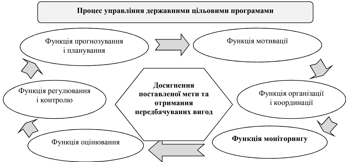
Рисунок 2 - Моніторинг в процесі управління державними цільовими програмами

На нашу думку, моніторинг повинен здійснюватися у послідовності наведеній на рис. 3.