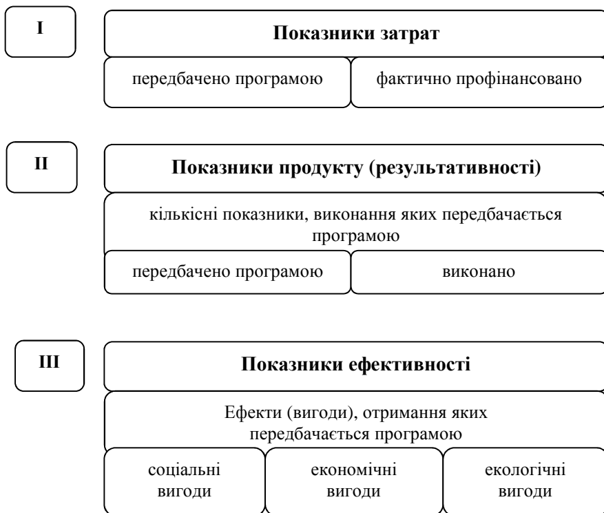
Рисунок 4 – Система показників виконання державних цільових програм

Для прикладу, при виборі показників, що характеризуватимуть соціальні вигоди, слід розуміти, що для цього необхідна сукупна система характеристик, показників і параметрів, що у своїй єдності спроможні відобразити стан задоволення суспільних потреб за їх окремими видами [13].