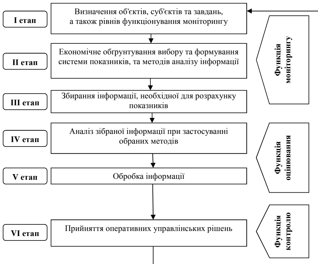
Рисунок 3 – Етапи моніторингу в процесі управління державними цільовими програмами