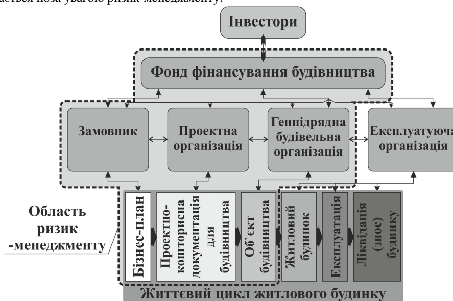
Рисунок 1 – Схема взаємодії учасників проекту будівництва житла з фінансуванням через ФФБ