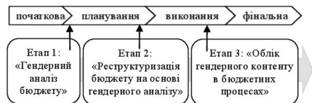
Рисунок 1 – Етапи гендерного бюджетування у життєвому циклі проекту

Процеси гендерного бюджетування реалізуються у три етапи: гендерний аналіз бюджету; реструктуризація бюджету на основі гендерного аналізу; облік гендерного контексту в бюджетних процесах [2, р. 16], і можуть бути інтегровані у загальний життєвий цикл проекту (рис. 1).