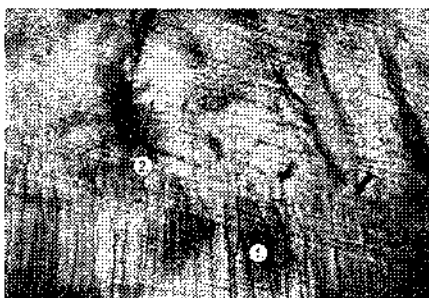
Мал.4. Премоляр. Дентин та емаль під пломбою: 1-термінальні відростки одонтобластів; 2- ламела; 3- розростання емалевих кущиків. Забарвлення ШИК+альціановій синій, збільшення 250 р.

дентину зливаються з контурами емалевих кущиків ( мал.4 ).