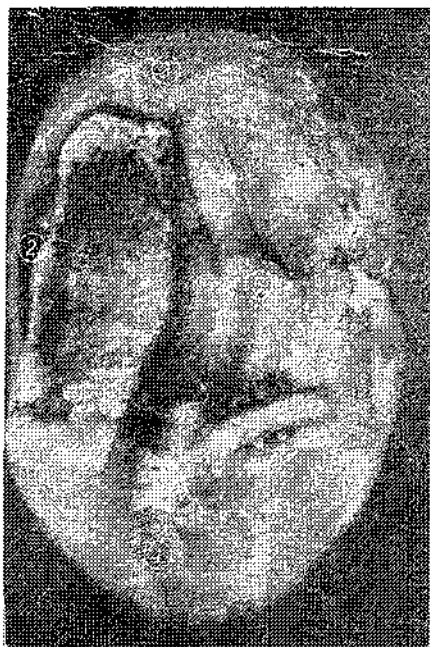
Мал.2. Премоляр: 1- дистостиль; 2- мезостиль; 3- еоконус; 4- дистоконус; 5- центральна борозна Забарвлення ШИК+альціановій синій

Крім цього, чітко визначається пломба малинового кольору в ділянці центральної фісури по глибині в кордонах емалево-дентинної межі.