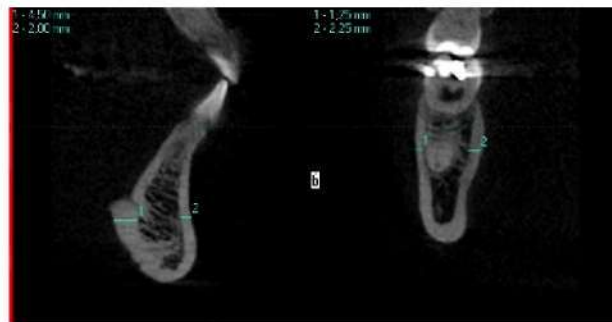
Рис. 1. Порівняння товщини кортикальних пластинок у підборідному відділі та на рівні перших молярів (зображення з вікна програми «iCATVision»)

Значне навантаження на нижній щелепі отримує підборіддя. У цій ділянці перехрещуються трабекули двох половин щелепи і виникає найгущіша система балок. Товщина кортикальних пластинок у підборідді максимальна порівняно з іншими ділянками нижньої щелепи, а кількість губчастої речовини мінімальна і може бути взагалі відсутня. При аналізі комп'ютерних томограм виявлено, що товщина язикової кортикальної пластинки в ділянці підборіддя на рівні нижньої третини була в середньому 4,54 \pm 1,33 мм, вестибулярної пластинки - 2,17 \pm 0,36 мм, з максимальним значенням 8,49 мм із язикового боку. Причому в інших відділах тіла нижньої щелепи товщина компактної кістки була значно меншою (рис. 1). Так, наприклад, у ділянці молярів на рівні середньої третини - в середньому 1,37 \pm 0,42 мм, а мінімально - 0,8 мм.