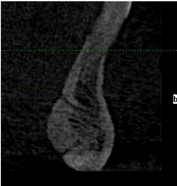
Рис. 3. Верхній і нижній язикові отвори з однойменними каналами на комп'ютерній рентгенограмі нижньої щелепи

На всіх комп'ютерних томограмах нами були виявлені язикові отвори в ділянці підборіддя, через які в кістку входять гілочки під'язикових артерій [5]. Зазвичай виявляли 2 отвори - верхній і нижній, розташовані не чітко по середній лінії (де кістка найщільніша), а дещо збоку від неї - від 0,5 до 6 мм латеральніше. Діаметр отворів складав у середньому 1,24 \pm 0,32 мм, причому верхні отвори зазвичай були ширші (рис. 3).