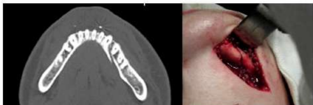
Рис. 6. Різні рівні ушкодження вестибулярної та язикової кортикальних пластинок, вигляд на зрізі комп'ютерної томограми і під час оперативного втручання

Лінія перелому локалізувалася найчастіше в ділянці центральних і бокових різців (63 %), рідше - між боковим різцем та іклом (19,6 %) та іклом і першим премоляром (15,2 %). Якщо перелом проходить у місці прикріплення м'язів, що опускають нижню щелепу, то фрагменти часто не просто зміщуються, а «вивертаються» зі щільним контактом у ділянці альвеолярного краю та значним розходженням по нижньому краю [13]. У цьому випадку зміщення залежить не тільки від тяги м'язів, а й від розташування лінії перелому на внутрішній і зовнішній компактних пластинках. Причому, чим ближче до середньої лінії розташована щілина перелому на зовнішній пластинці, тим далі від неї проходить лінія перелому на язиковій пластинці і тим вищий ступінь зміщення фрагментів у горизонтальній площині. Для оцінки рівня uszkodження кортикальних пластинок ми використовували комп'ютерні томограми і візуальну оцінку на огляді та під час оперативного втручання (рис. 6). Виявлено, що в більшості випадків язикова кортикальна пластинка ушкоджується латеральніше, ніж вестибулярна, рідше - лінії перелому на обох пластинках розташовані практично на одному рівні. Випадків, коли ушкодження язикової пластинки розташоване медіальніше, ніж вестибулярної, ми не виявили.