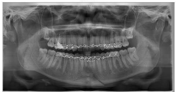
Рис. 5. Ортопантомограма хворого з переломом нижньої щелепи в ділянці підборіддя. Відрив центрального фрагмента у вигляді трикутника