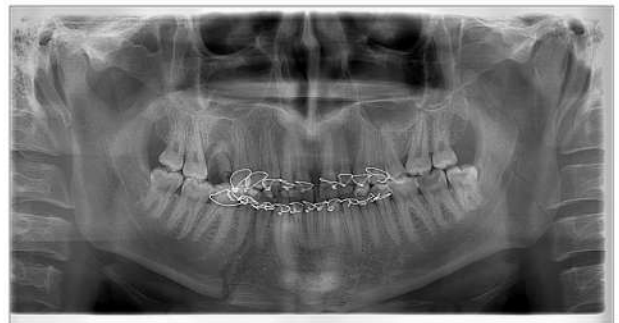
Рис. 4. Ортопантомограма хворого з переломом нижньої щелепи в ділянці 44, 45 зубів. Розходження фрагментів перелому по нижньому краю щелепи після консервативного лікування