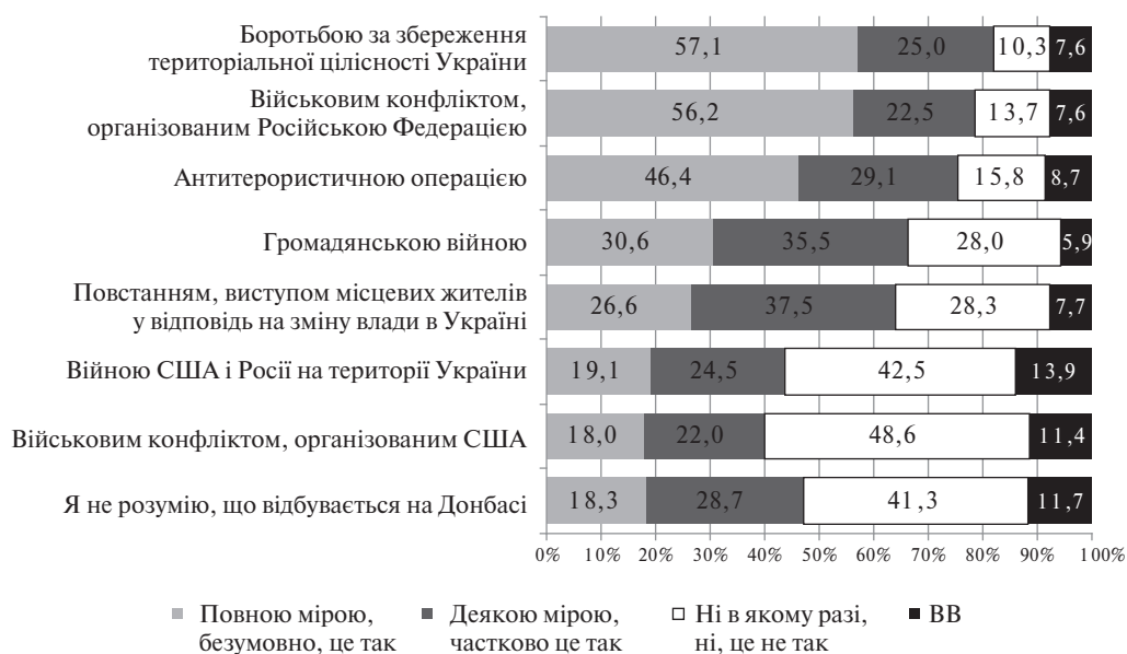
Рис. 3. Розподіл відповідей на запитання: «Якщо говорити про ситуацію на Донбасі, то якою мірою те, що зараз відбувається, можна вважати...?»

організована Росією, а також 3) антитерористична операція. Беззастережно підтримали ці варіанти майже половина респондентів. Якщо додати тих, хто згоден частково, то підтримка цих варіантів набирає від 75,5% до 82,1%.