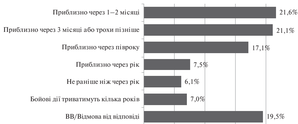
Рис. 2. Оцінки населенням перспектив завершення бойових дій на Донбасі

Більшість українців вважають, що конфлікт на Донбасі не буде затяжним: майже 60% – триватиме більше півроку, а 21,6% – закінчиться через 1–2 місяці (рис. 2). Щоправда, кожен п'ятий респондент мав труднощі з відповіддю.