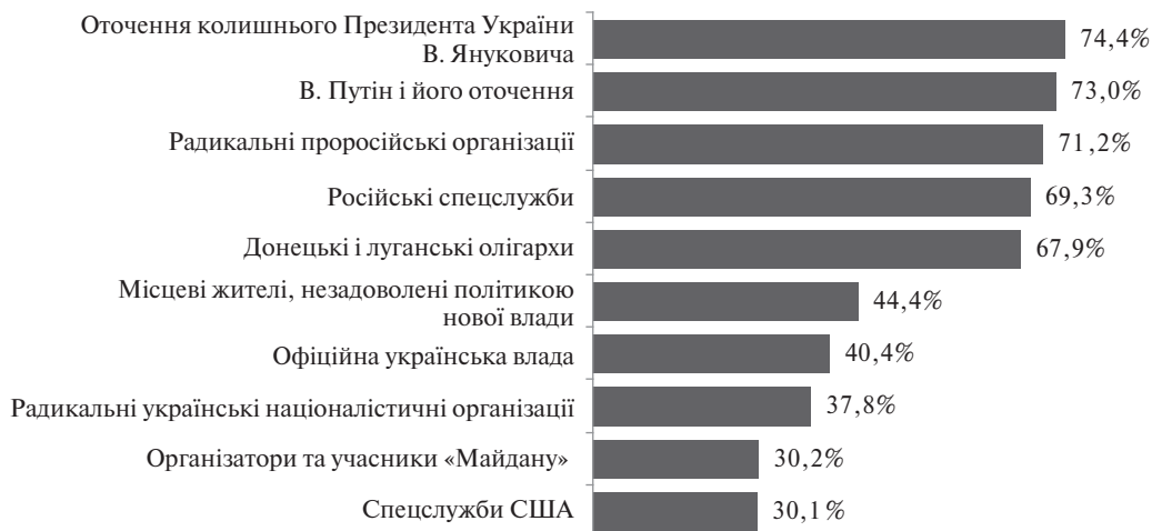
Рис. 4. Частка опитаних, згідних з тим, що такі суб'єкти продовжують сприяти силовому протистоянню та бойовим діям на Донбасі, %