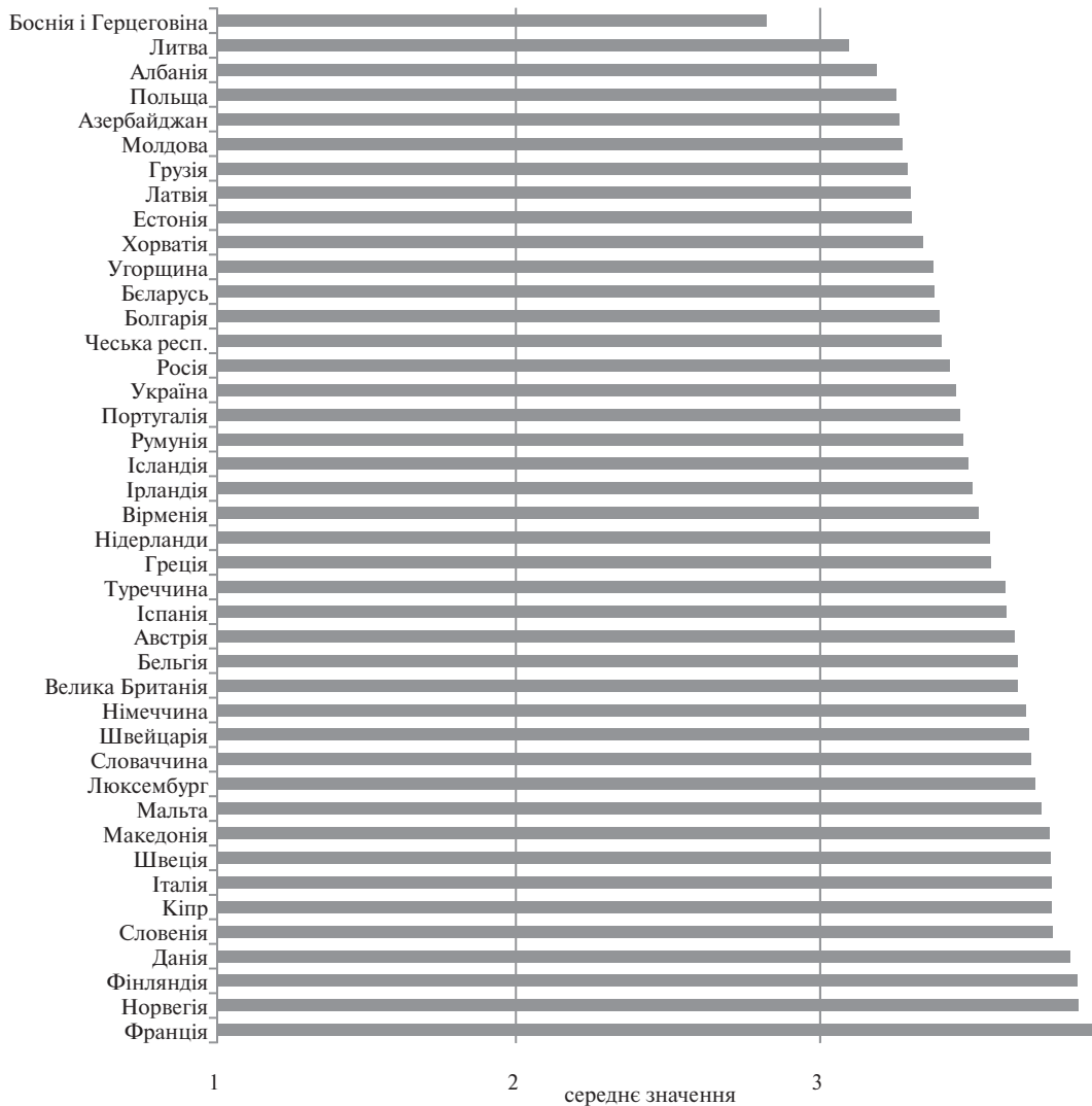
Рис. 1. Важливість поваги до політичних інститутів і законів країни, 2008–2010 рр.

Оскільки більшість респондентів відповіли, що важливими є обидві вимоги, то для вирішення саме модерної толерантності був побудований індекс, який розраховувався за формулою: вектор значень поваги до політичних інститутів і законів країни (від 1 до 4), помножений на вектор значень важливості мати предків в країні (перекодований у шкалу від 0 до 3). У результаті був отриманий індекс модерної толерантності зі значенням, що змінюється від 0 до 12, де 0 – мінімальна модерна толерантність, 12 – максимальна модерна толерантність. Тобто для такого модерного ставлення є неприйнятними порушення законів і неповага до існуючих інститутів, проте національне і територіальне походження людини не має жодного значення.