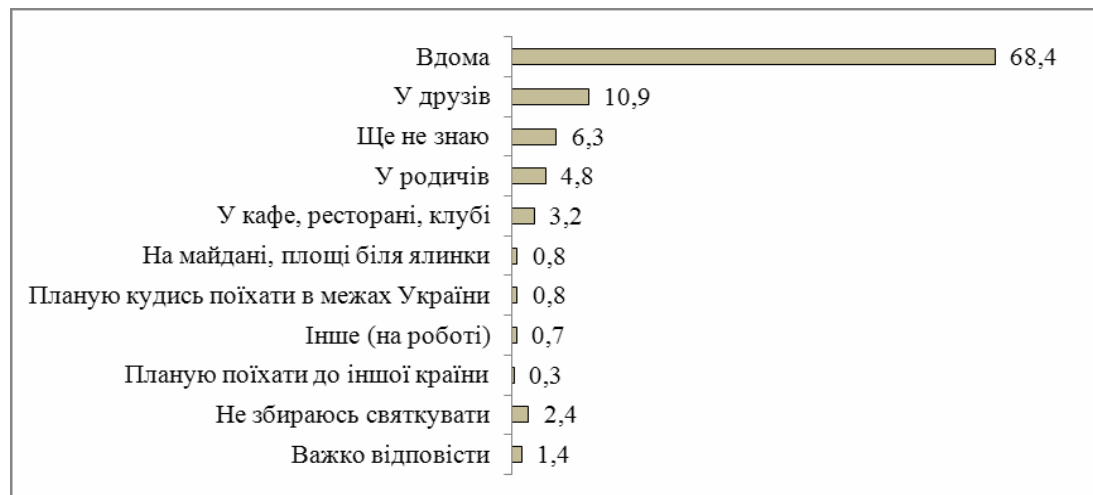
Рис. 2. Розподіл відповідей респондентів на запитання: “Де Ви плануєте зустрічати Новий рік?”, %

Найпопулярнішим місцем для зустрічі Нового року в українців буде сімейна оселя: 68,4% опитаних зустрічатимуть свято вдома. Другим за популярністю стане святкування в колі друзів (10,9%). Близько 6% респондентів не знають, де святкуватимуть або вагаються з вибором, ще 4,8% – святкуватимуть у родичів, 3,2% – відвідають ресторан, кафе, клуб, 2,4% повідомили, що не збираються святкувати (рис. 2). Певні особливості новорічних планів спостерігаються, залежно від регіону та типу поселення. Найбільш значущими є розбіжності у відповідях різних вікових груп – старші покоління обирають зустріч Нового року вдома, для молоді більш популярним є зустріч у друзів.