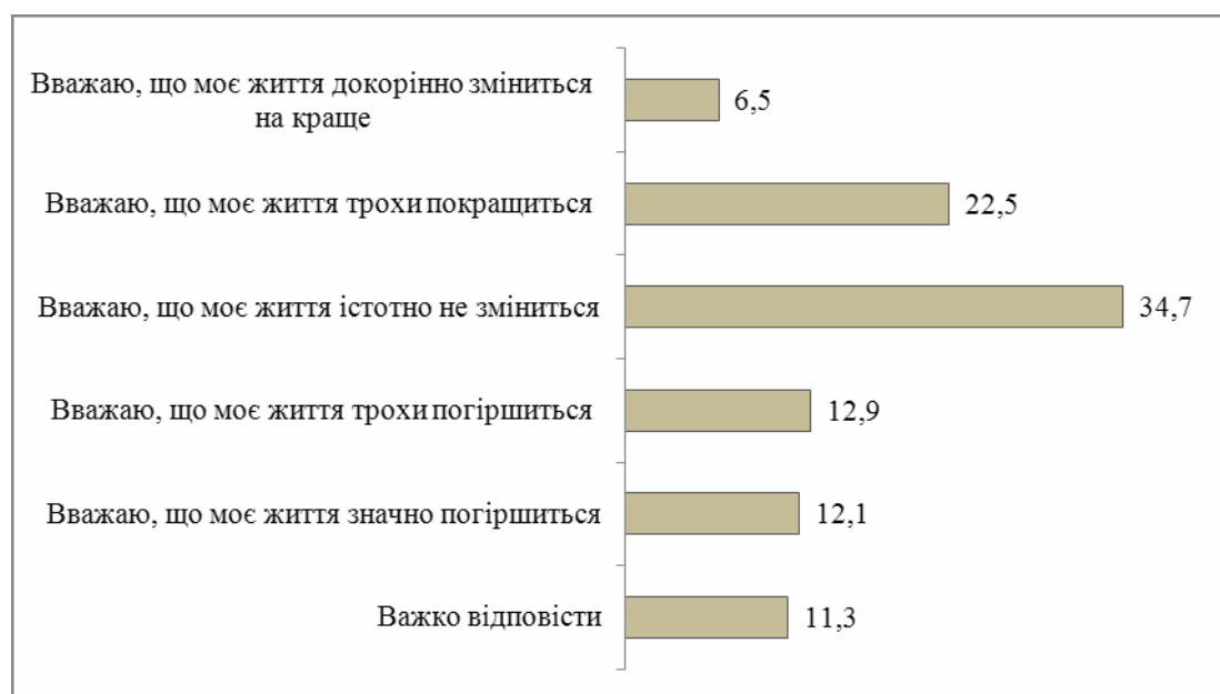
Рис. 1. Розподіл відповідей респондентів на запитання: “Незабаром 2018 р. З якими настроями Ви вступасте в нього?”, %

** Сума відповідей: “вважаю, що моє життя трохи погіршиться” та “вважаю, що моє життя значно погіршиться”.