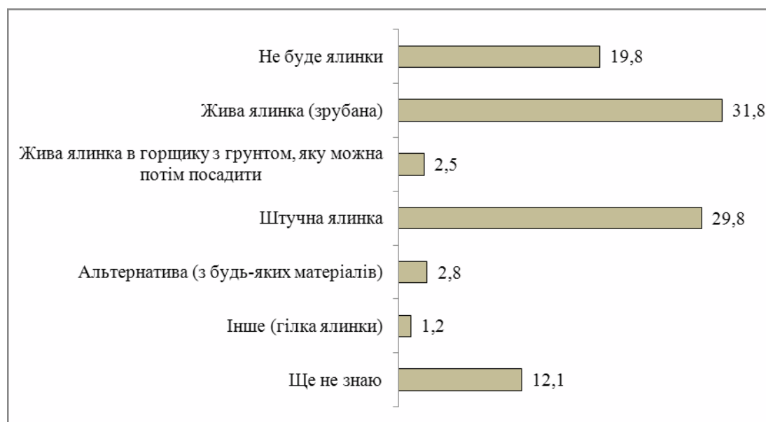
Рис. 4. Розподіл відповідей респондентів на запитання: “Якою у Вас буде новорічна ялинка”, %

Майже третина опитаних святкуватиме Новий рік з традиційною живою ялинкою (31,8%), ще майже третина (29,8%) наряджатимуть штучну, точно не буде ялинки у 19,8% опитаних (рис. 4).