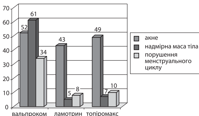
Рис. 2. Переносимість монотерапії вальпрокомом, ламотрином та топіромаксом

У 1-й групі при прийомі вальпрокому відмічалися акне у 52 %, надмірна вага — у 61 %, порушення менструального циклу — у 34 %; у 2-й групі при прийомі ламотрину — акне у 43 %, надмірна вага — у 5 %, порушення менструального циклу — у 8 %; у 3-й групі при прийомі топіромаксу — акне у 52 %, надмірна вага — у 7 %, порушення менструального циклу — у 10 % (рис. 2).