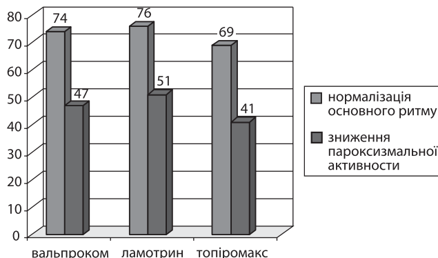
Рис. 3. Вплив монотерапії епілептичнихпадів на показники ЕЕГ

групі при прийомі топіромаксу — нормалізація основного ритму у 69 %, зниження пароксизмальної активності — у 41 % (рис. 3).