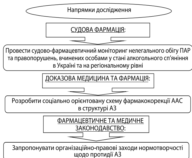
Рис. 1. Напрямки дослідження

Для досягнення поставленої мети було обрано мультидисциплінарний підхід — на засадах медичного та фармацевтичного права в рамках судової фармації, доказової медицини, доказової фармації та медичного і фармацевтичного законодавства удосконалити заходи протидії при АЗ (F10.2), а саме — провести судово-фармацевтичний моніторинг нелегального обігу ПАР та правопорушень, вчинених особами у стані алкогольного сп'яніння в Україні та на регіональному рівні (судова фармація); розробити соціально орієнтовані схеми фармакокорекції ААС в структурі АЗ (доказова медицина і фармація); запропонувати організаційно-правові заходи нормотворчості щодо протидії АЗ на регіональному рівні (фармацевтичне та медичне законодавство), що наведено на рис. 1.